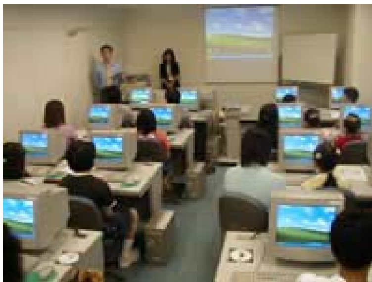
第8回(2003年)アニメーション神戸における「神戸こどもアニメーション教室」の様子